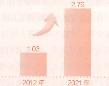
全社会研发投入(万亿元)

中国经济总量占世界经济比重从 11.4% 提升到 18.5% ，对世界经济增长的平均贡献率超过 30% ，居于首位