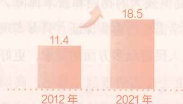
中国经济总量占世界经济比重(%)

中国经济总量占世界经济比重从 11.4% 提升到 18.5% ，对世界经济增长的平均贡献率超过 30% ，居于首位